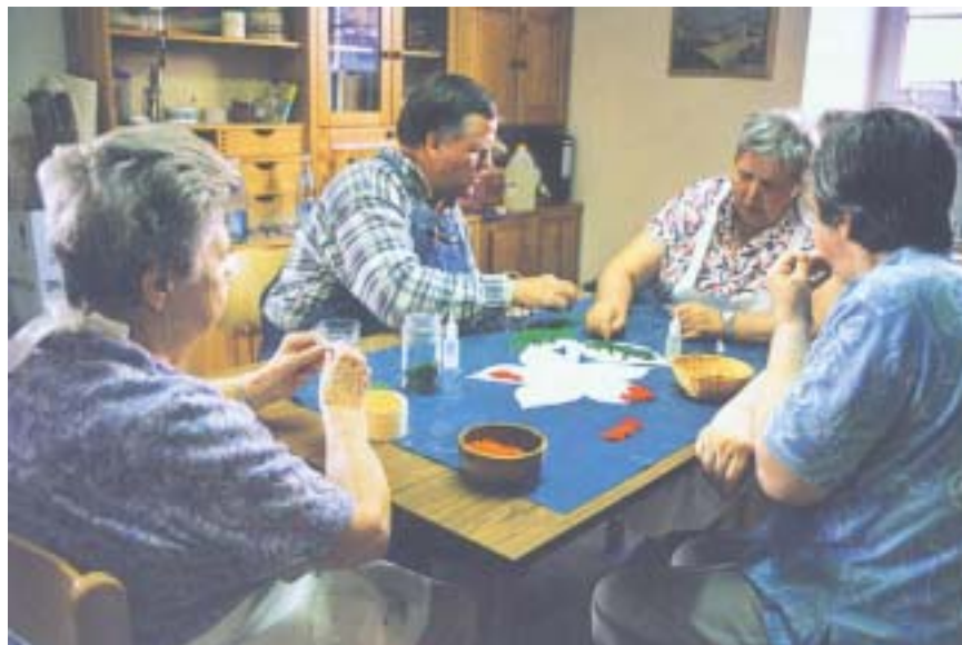
Heimbewohnerinnen und Heimbewohner basteln in einem Gemeinschaftsraum des Pflegeheimes in Meerholz.

Wir schließen den Verstorbenen und seine Angehörigen in unsere Fürbitte ein und befehlen sie der Liebe Gottes an.