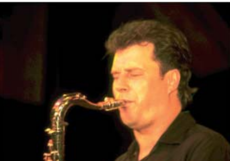
Saxofonist Jochen Engel